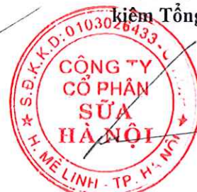
HÀ QUANG TUẤN